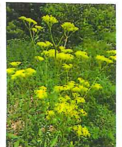
女郎花 (おみなえし)